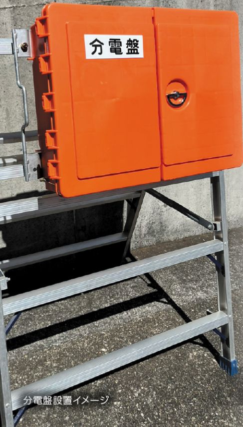
分電盤設置イメージ