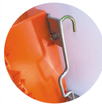
万能フックの 取り付け可能