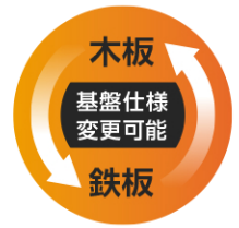
木製基板を鉄板仕様 に変更可能