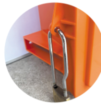
南京錠の取付穴有り